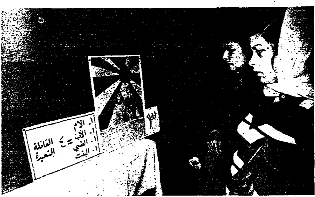
الحجم الامتلاء لخدمة السيدة